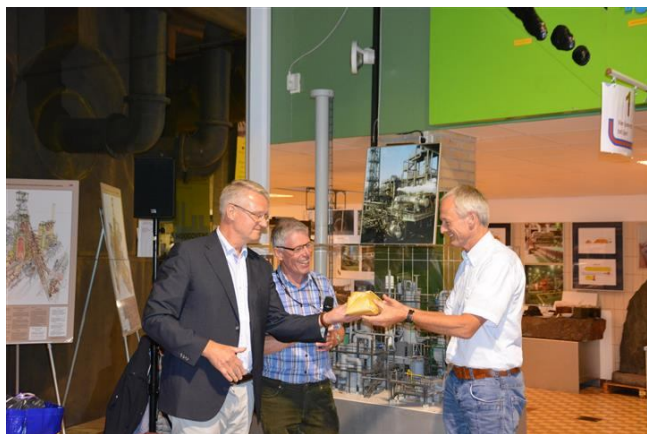
Overhandiging cabinelamp voor treinstel 252

De droogte –toen al- zorgde in de vorm van een aantal brandjes helaas voor vertraging waardoor de fotostop moest vervallen.