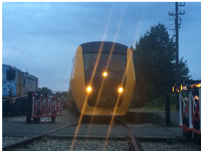
's-Avonds na afloop van de Vriendendag wordt de Buffel het museum ingereden.

Overigens: onze Vriend die tijdens de stop in Den Haag Centraal onwel werd, kon na behandeling in het ziekenhuis zijn weg zelfstandig vervolgen.