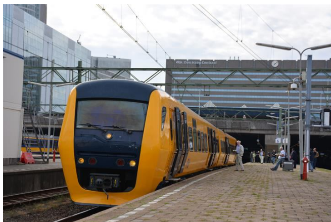
De Buffel te Den Haag Centraal

Na afloop ging het gezelschap weer met een tweetal NZH museumbussen terug naar station Beverwijk. Na een geslaagde rit werd de Buffel in het schemerdonker voor de nacht in het museum opgesteld.