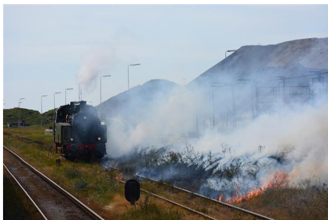
Brandjes veroorzaakt door stoomloc 57. De loc loopt hier om langs de excursietrein.

De droogte –toen al- zorgde in de vorm van een aantal brandjes helaas voor vertraging waardoor de fotostop moest vervallen.