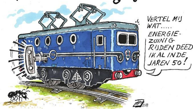
Cartoon van Hans Proper