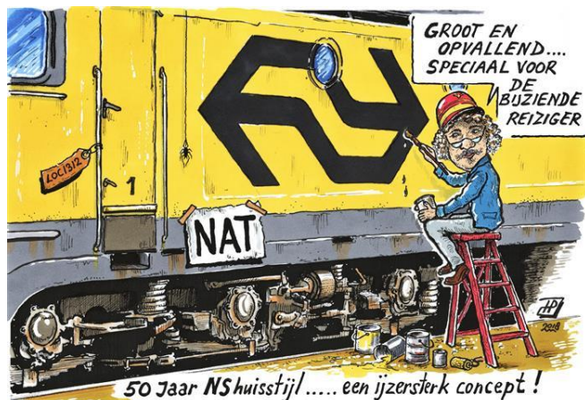
Cartoon van Hans Proper

doorbraak: de introductie van het nieuwe NS-logo en de gele kleur van het materieel. Het bleek een gouden greep en dat de huisstijl nu, 50 jaar later, nog steeds niets aan zeggingskracht heeft ingeboet zegt genoeg.