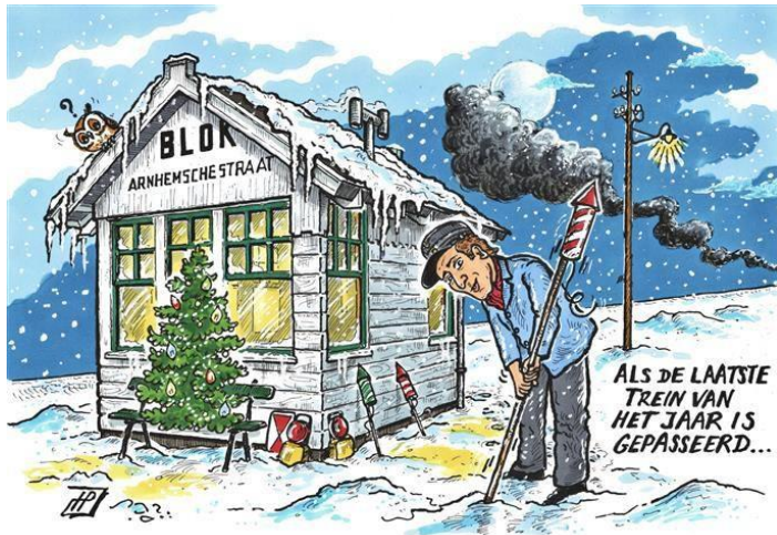
Cartoon: Hans Proper