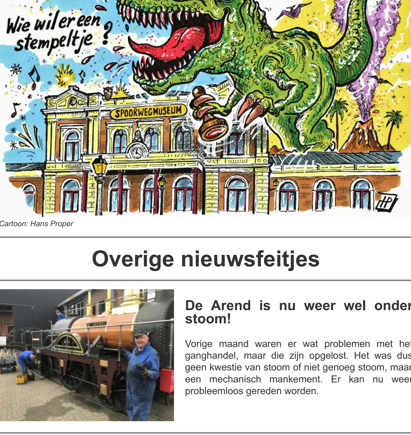
Cartoon: Hans Proper

bekend. Naast deze twee musea zullen het Nederlands Militair Museum, Beeld en Geluid, het Rijksmuseum van Oudheden en het Spoorwegmuseum zelf een 'bestemming' verzorgen. Met een speciaal paspoort kun je langs de bestemmingen reizen. Bij iedere bestemming krijg je een stempel. Met een vol paspoort kun je de magische eindbestemming bezoeken. Met het Rijksmuseum voor Oudheden reis je terug naar de Oudheid en beleef je hoe de oude Egyptenaren omgingen met hun doden. Het Nationaal Militair Museum heeft op hun bestemming 'Onder de radar' camouflage als onderwerp, daar kun je volledig opgaan in de omgeving. Beeld en Geluid dempelt je onder in de wereld van de radio, hier leer je zelf een radio-uitzending of een podcast te maken. Het theater is de toepaselijke plek voor de bestemming van het Kinderboekmuseum, waar het werk van Annie M.G. Schmidt wordt geëerd door verschillende kunstenaars. Het Cobra Museum neemt de bestemming 'Kunst' voor haar rekening, met wat hulp maak je je eigen Cobra kunstwerk! Het Spoorwegmuseum tenslotte neemt je mee van Parijs naar Constantinopel voor een smakelijke culinaire treinreis. Ook is er een verrassende eindbestemming, maar daarover later meer.