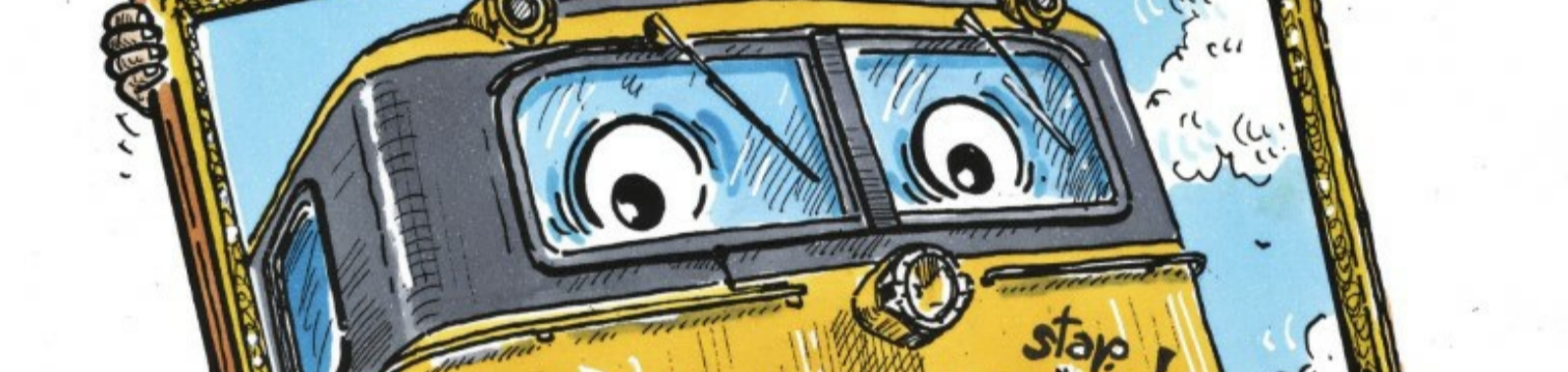
Cartoon: Hans Proper