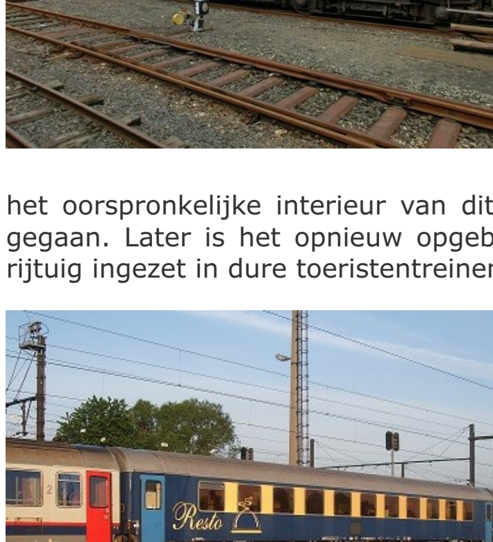
Veluwse Stoomtrein Maatschappij in bruikleen.

Hier een overzicht met de bijzonderheden.