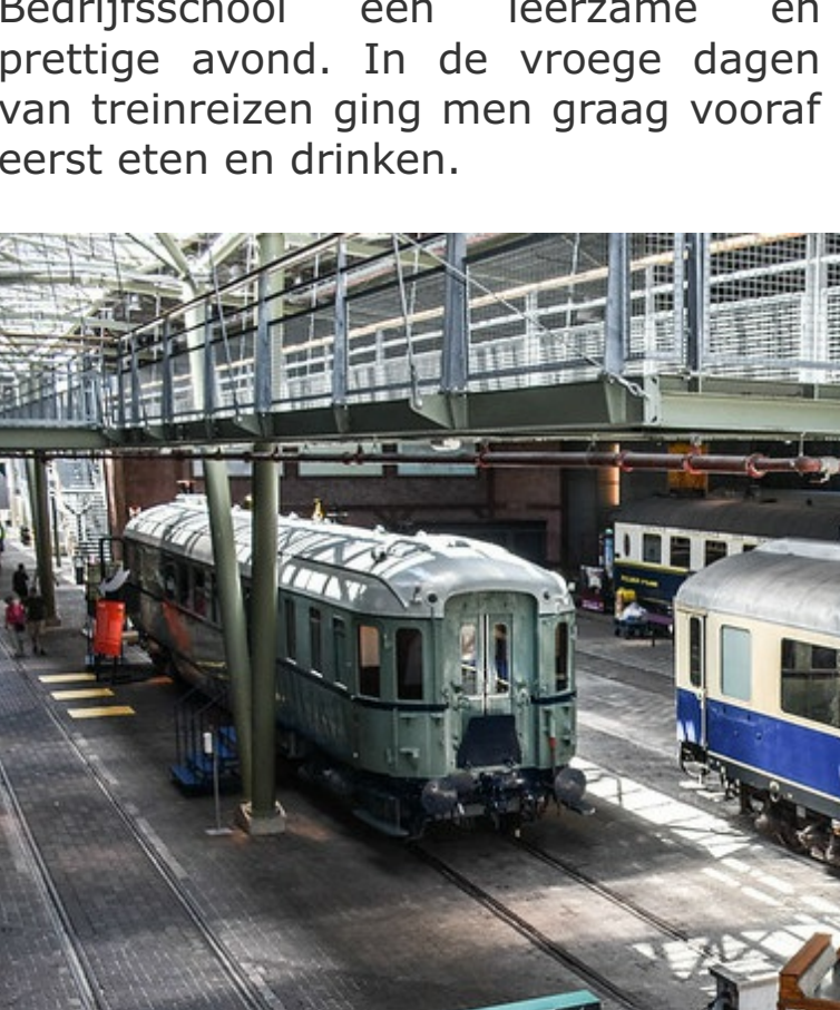
Achtergrondinformatie bij beide postzegels

Er is weer een nieuwe postzegel beschikbaar en wel met de afbeelding van de jongste aanwinst voor de collectie van het museum: EI2 2133 van het type Stads Gewestelijk Materieel (SGM), plan Y, kortweg SGMm 2133. Dit stel kwam vóór de modificatie aan dit materieel in dienst als EI2 2023.