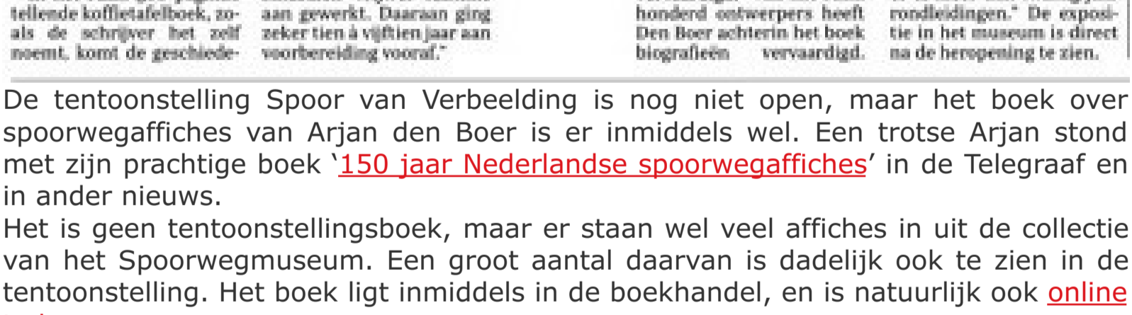
De Utrechtse treinreiziger Arjan den Boer heeft in zijn privécollectie ook een groot aantal schitterende spoorwegaffiches. Hij verzamelde er 350 voor zijn 'affichetafelboek'.

Het is geen tentoonstellingsboek, maar er staan wel veel affiches in uit de collectie van het Spoorwegmuseum. Een groot aantal daarvan is dadelijk ook te zien in de tentoonstelling. Het boek ligt inmiddels in de boekhandel, en is natuurlijk ook online te koop . Werkelijk een prachtig boek. Meer informatie is te vinden op de website van Arjan.