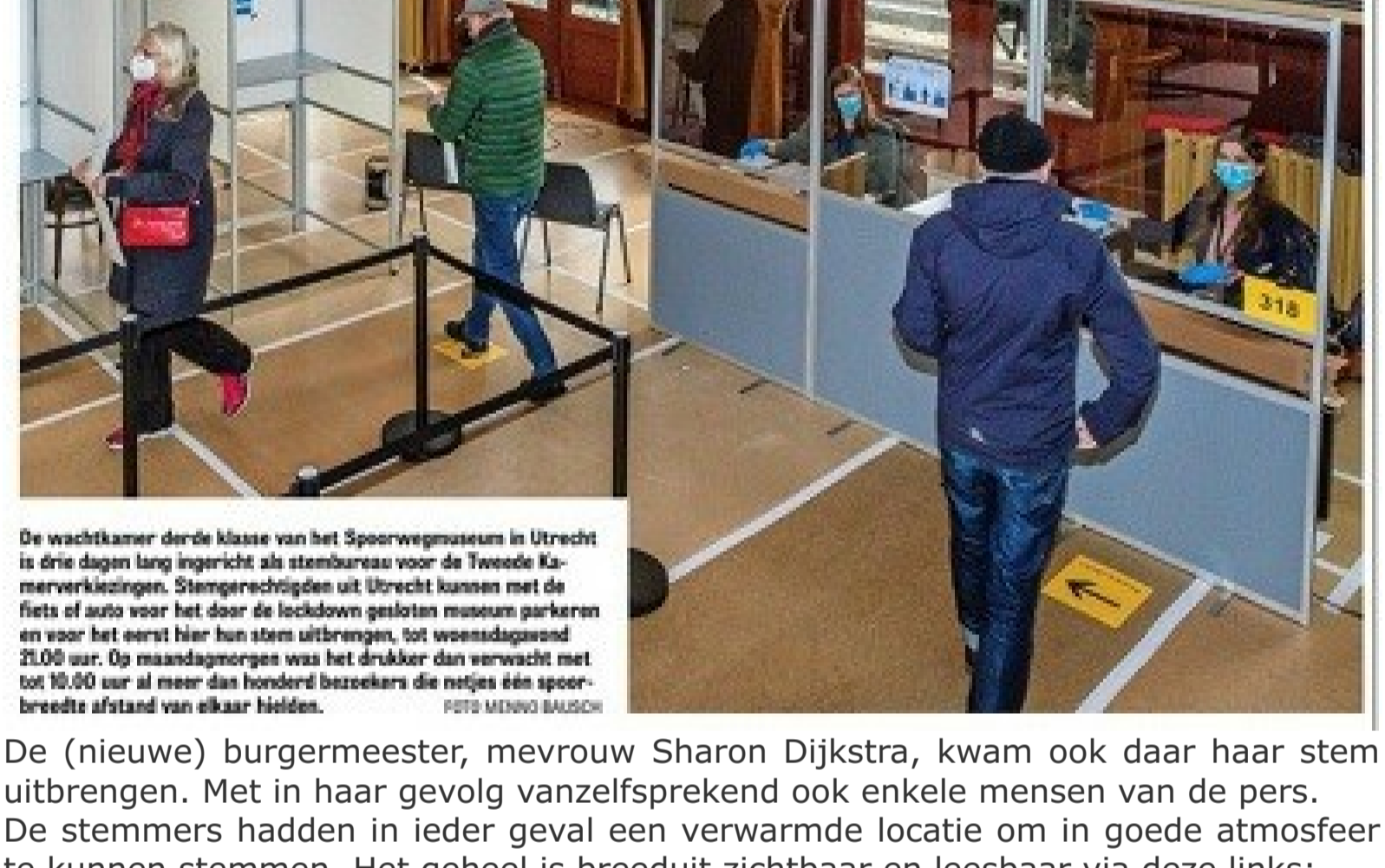
De wachtkamer derde klasse van het Spoorwegmuseum in Utrecht is drie dagen lang ingericht als stembureau voor de Tweede Kamerverkiezingen. Stemberechtigden uit Utrecht kunnen met de fiets of auto voor het door de lockdown gelosten museum parkeren en voor het eerst hier hun stem uitbrengen, tot woensdagavond 21.00 uur. Op maandagmorgen was het drukker dan verwacht met tot 50.000 uur al meer dan honderd bezoekers die netjes één voor één de wachtkamer afstapten.

Vrijwilligers van het museum hielpen mee met het uitvoeren van de stemprocedures. Dat kiesgerechtigden hun stem konden uitbrengen in zo'n mooie locatie was voor veel pers reden om langs te komen voor een reportage of foto. Dit leverde direct een mooie foto op voor de Telegraaf (zie foto onder). Ook de 5 Ur Show en RTL Nieuws kwamen naar de Maliebaan voor een reportage. Het Spoorwegmuseum stond er mooi op in alle RTL-journaals van die dag. En zo konden buurtbewoners wel even naar binnen in het museum!