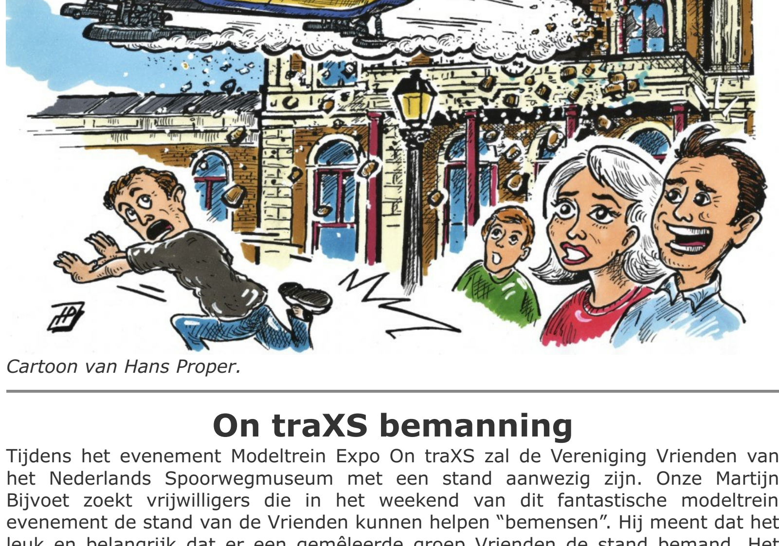
Cartoon van Hans Proper.