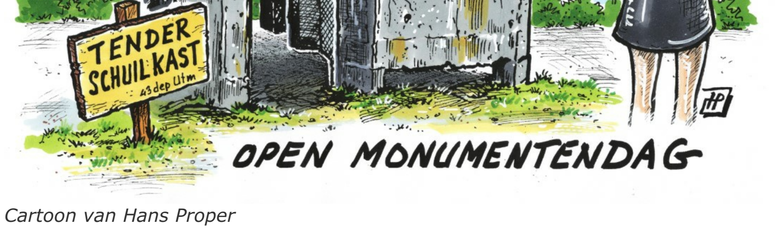
Cartoon van Hans Proper