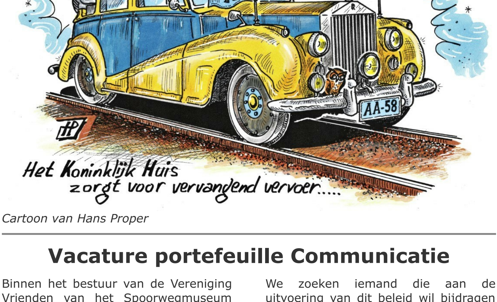
Cartoon van Hans Proper